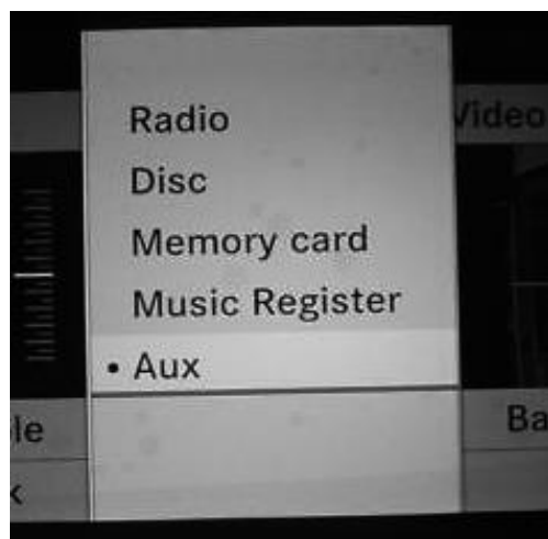
Audio → AUX → OK

Er der allerede fabriksmonteret AUX stik i bilen skal dette frakoblet ved installation af BT Audio modul. dvs. at pins i overstående position 1 til 4 skal afmonteres stikket fra Connector B